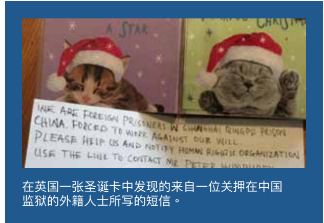
在英国一张圣诞卡中发现的来自一位关押在中国监狱的外籍人士所写的短信。

同时, 在对翻墙软件虚拟私人网路 (VPN) 的加紧审查和加剧打压下, 每月依然有数百万的中国人持续利用此工具翻过网路防火墙。事实上, 据诸如 GlobalWebIndex 和 Hootsuite 类的市场营销公司报导, 估计有31 ~ 35%的中国网民在2019年使用VPN。如果是对全中国8亿网民的报导准确, 将有相当于大约2亿5千万的人在翻越网路防火墙。