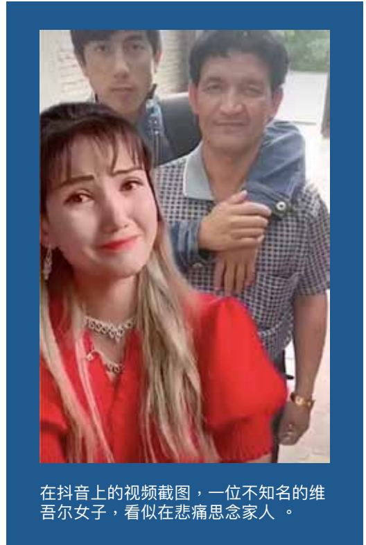
在抖音上的视频截图，一位不知名的维吾尔女子，看似在悲痛思念家人。

同时，抖音和其国际同类平台TikTok（也译作「抖音」）已出现成为重要的证据来源，如果这种看似不可能的成为可能，已成为主要的新疆镇压和该地区失踪孩子的视频证据。尽管证实这些视频的准确性很还有困难，在政府官方或官方媒体帐号上发布的这些短视频，已能使海外观察人士和家属们以此进行辨认和保留维吾尔人孤儿的镜头，包括父母被拘留的维吾尔儿童，清真寺被拆毁的事件视频，全副武装的警察训练的图片，或为中共党校干部培训班的片段。