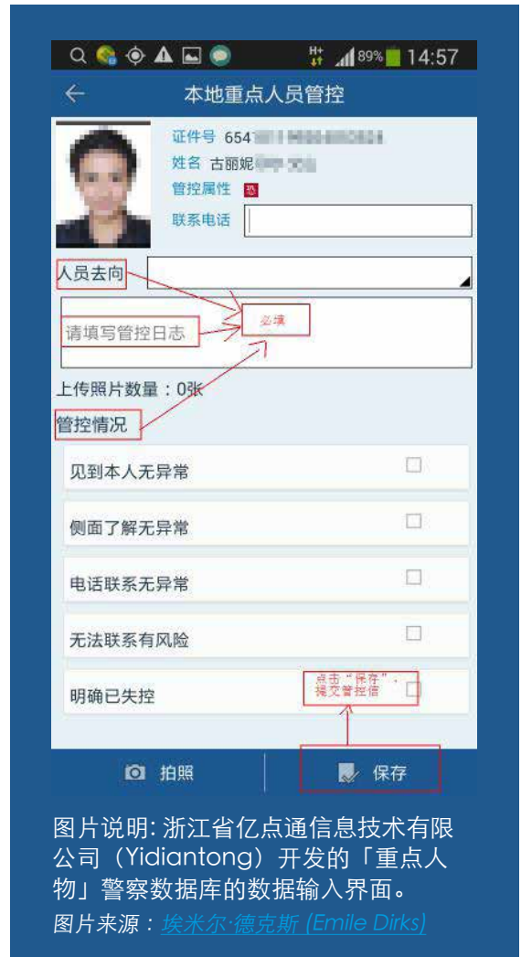
图片说明: 浙江省亿点通信息技术有限公司 (Yidiantong) 开发的「重点人物」警察数据库的数据输入界面。

另一个隐忧，则是重点人物监控技术被输出到其它国家。「开放技术基金( Open Technology Fund )」上月发布的一项研究报告中，列出了各式被出售到五大洲、至少73个国家的中国监控和网络审查设备。输出国家不只有其他成熟的专制国家，如埃及或亚塞拜然；更有半专制的、甚至民主国家，如巴西、坦桑尼亚、波兰和南韩。报告指名的科技公司中至少有三家-浙江大华技术股份有限公司（简称 大华Dahua ）、北京深醒科技有限公司（ Sensetime ）和 海康威视 (Hikvision) - 这些公司除了提供面部识别摄像头，更输出追踪特定重点人物的监控技术给其它国家。